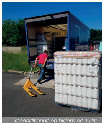
... reconditionné en bidons de 1 litre

Le laboratoire en cosmétiques naturels souhaite désormais investir à long terme le local industriel pour maintenir cette activité dont la demande ne cesse d'accroître.